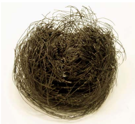
24. Summa summarum. Draht 11 x 16 x 16 cm