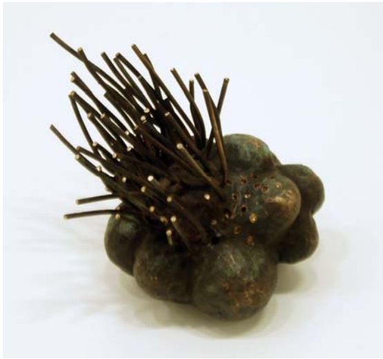
17. Ohne Titel, 2008. Bronzeguss. Unikat 18 x 17 x 14 cm