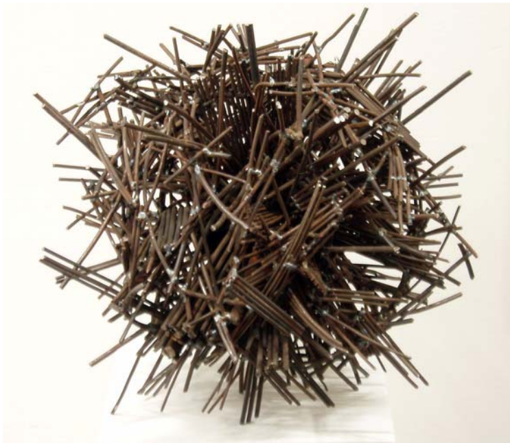
6. Antikörper, 2007. Eisendraht gescheißt 50 x 50 x 50 cm