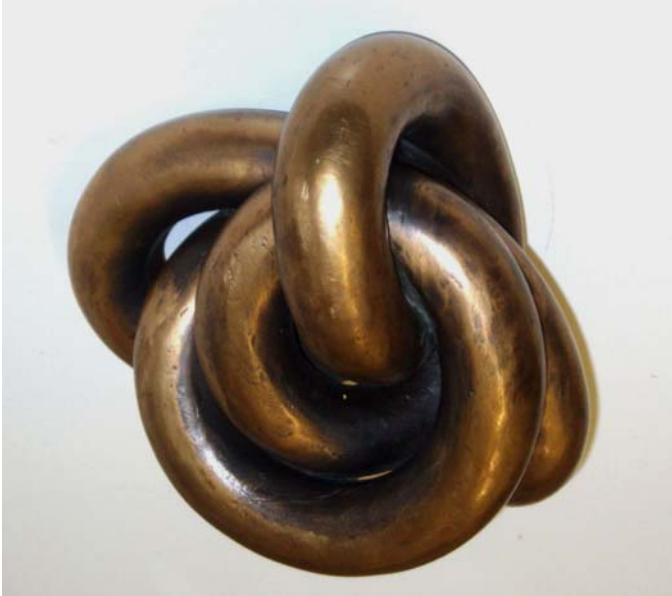
19. Knoten, 2004. Bronzeguss im Wachsauerschmelzverfahren. Unikat 19 x 21 x 13 cm