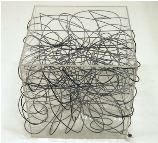
2 my home is my castle, 2002. Acrylglas und Edelstahlseil 25,5 x 31 x 31 cm