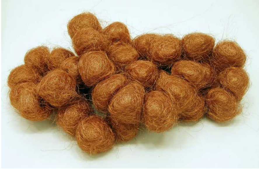
25. Ohne Titel, 2008. Kupferdraht gerollt frei legbare geschlossene Kette