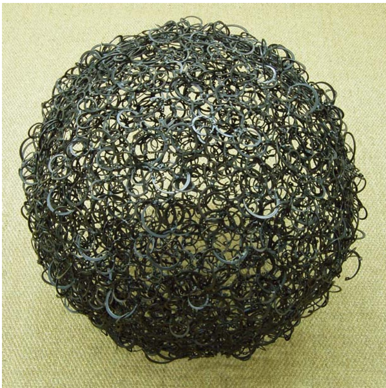
16. Sinnkugel Nr. 13, 2004. Spannringe geschweißt 65,0 x 65,0 x 65,0 cm