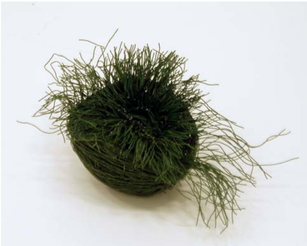
22. Summa summarum. Draht 12 x 23 x 10 cm