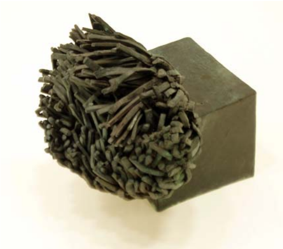
15. Ohne Titel, 2004. Bronzeguss im Wachsauerschmelzverfahren. Unikat 19 x 19 x 18 cm