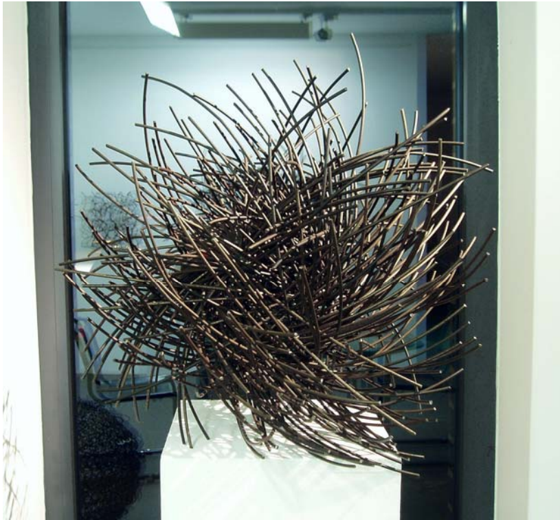
5. Antikörper, 2000. Eisendraht gescheißt 55 x 55 x 55 cm