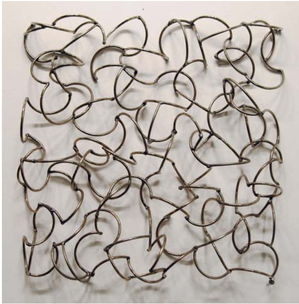
11. Unruhekissen, 2008. Verchromtes Rohr gebogen und verschweißt 50 x 50 x 8,5 cm