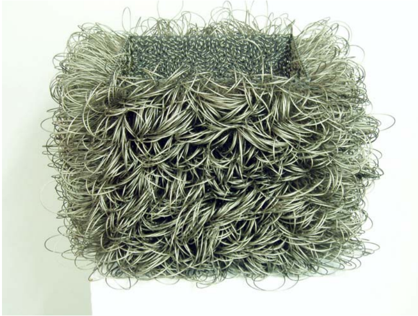
1. my home is my castle, 2003. Lochblech und Edelstahlseil 35 x 58 x 58 cm