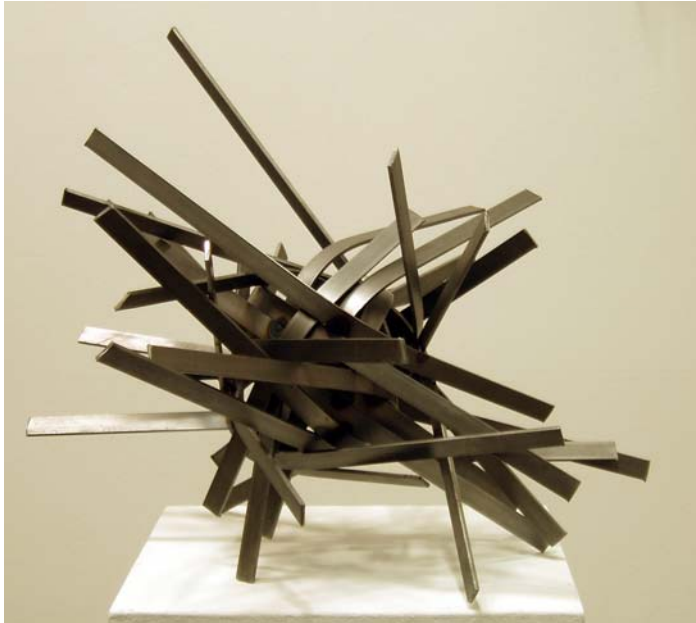
13. Wirbel, 2008. Stahlband geschweißt 40 x 45 x 45 cm