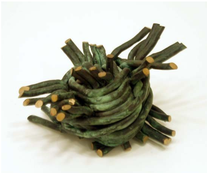
18. Knoten, 2004. Bronzeguss im Wachsauerschmelzverfahren. Unikat 12 x 19 x 15 cm