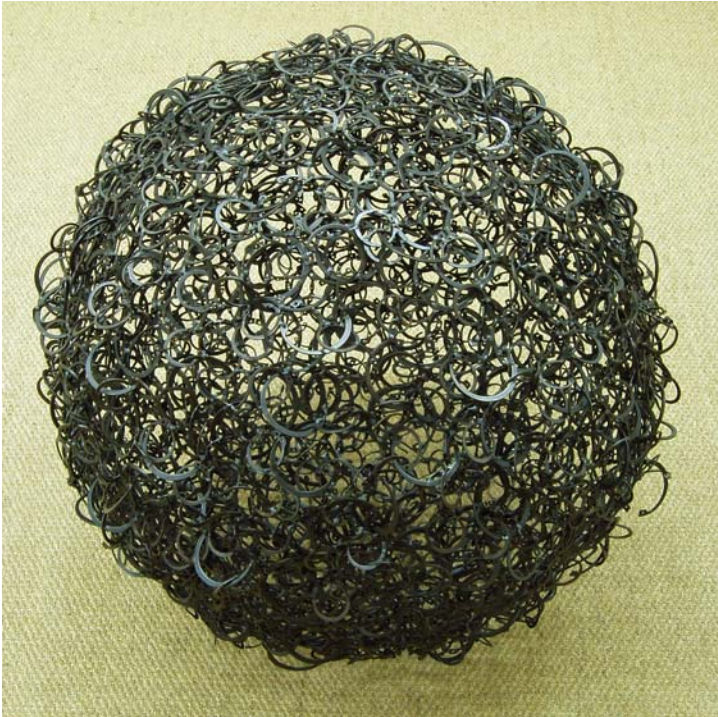
9. Sinnkugel, 1997. Eisendraht geschweißt und Kupferdraht 62 x 62 x 62 cm