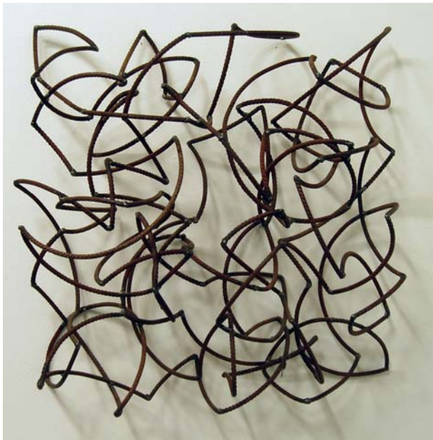
12. Unruhekissen Nr. 1, 1996. Baustahl geschweißt 50 x 50 x 20 cm