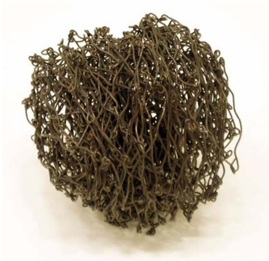
23. Summa summarum. Draht 16 x 16 x 16 cm