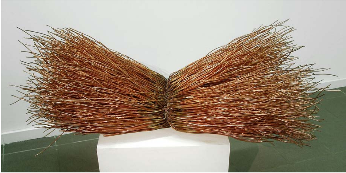
3. Antikörper, 2003. Kupferblech und Kupferdraht 50 x 130 x 50 cm