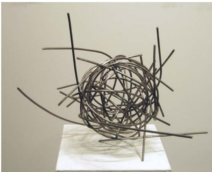
14. Ohne Titel, 2007. Stahldraht geschweißt 41 x 46 x 50 cm