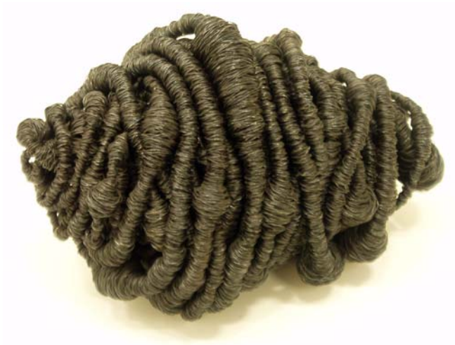
26. Mein Herz und deine Seele, 2000. Draht umwickelt 17 x 25 x 16 cm