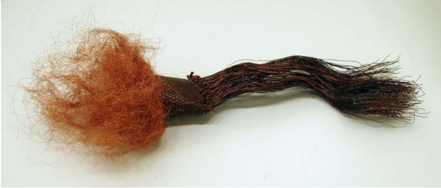
21. Summa summarum, 2007. Kupferdraht und Lochblech 64 x 28 x 18 cm