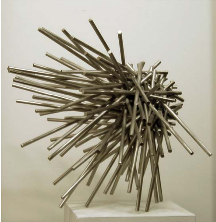
7. Antikörper, 2008. Edelstahlstäbe geschweißt 50 x 60 x 60 cm