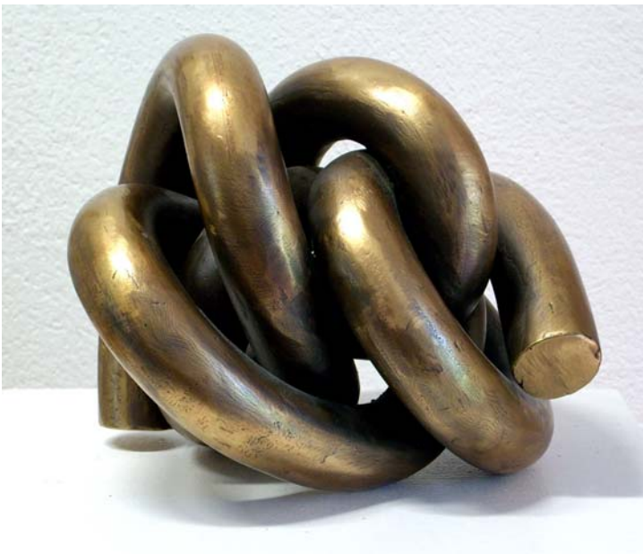
20. Knoten, 2004. Bronzeguss im Wachsauerschmelzverfahren. Unikat 18,0 x 21,0 x 21,0 cm